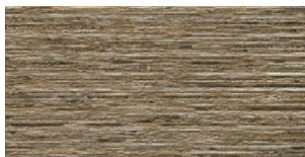
RELIEVE STONE TERRA MATE 30x60 SL G.64 | MATE | Pasta Neutra