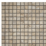
STONE MALLA BEIGE 30x30 ANTISLIP SP2037 | MATE |