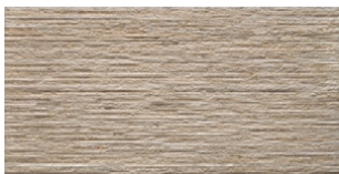
RELIEVE STONE BEIGE MATE 30x60 SL G.64 | MATE | Pasta Neutra