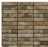
STONE TESELA TERRA MATE 30x30 ANTISLIP SP2037 | MATE |