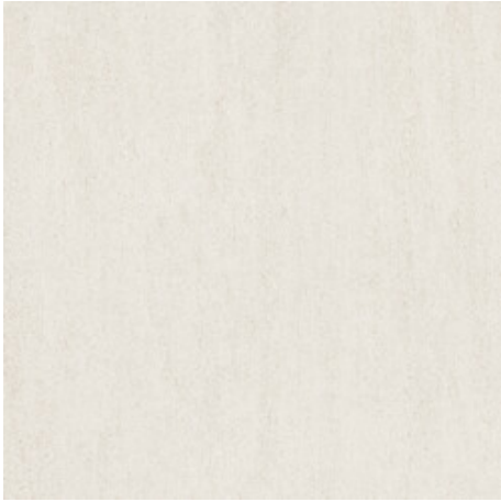
WHITE MATE 120x120 SL RC G.201 | MAT | Terre Neutre Rectifié.