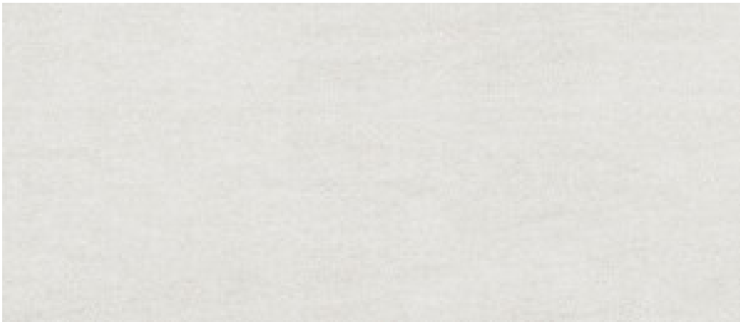
WHITE MATE 120X280 RC G.195 | MAT | Masse Coloré Rectifié.