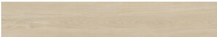
OAK MATE 25X150 SL RC G.148 | MAT | Terre Neutre Rectifié.