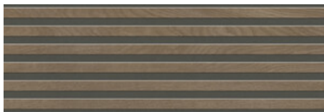
WALNUT MATE 30x90 XS RC G.112 | MAT | Pâte blanche Rectifié.