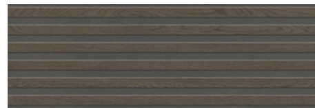
WENGUE MATE 30x90 XS RC G.112 | MAT | Pâte blanche Rectifié.