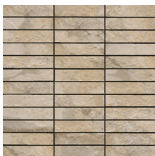
ARCATA STONE TESELA BEIGE MATE 30x30 ANTISLIP SP2039 | MAT |