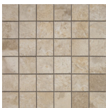
ARCATA STONE MOSAICO BEIGE 30x30 ANTISLIP SP2037 | MAT |