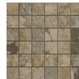
ARCATA STONE MOSAICO TERRA MATE 30x30 ANTISLIP SP2037 | MAT |