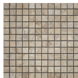
ARCATA STONE MALLA BEIGE 30x30 ANTISLIP SP2037 | MAT |