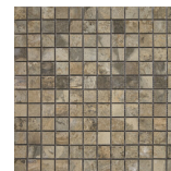
ARCATA STONE MALLA TERRA MATE 30x30 ANTISLIP SP2037 | MAT |