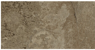
ARCATA STONE TERRA 30x60 SL ANTISLIP G.64 | MATT | Neutral Body