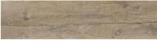
ELM MATE 30X120 XS G.75 | MATT | Neutrale Scherben