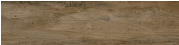
OAK MATE 30X120 XS G.75 | MATT | Neutrale Scherben