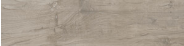
MAPLE MATE 30X120 XS G.75 | MATT | Neutrale Scherben