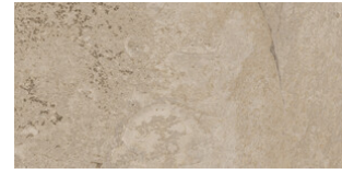
ARCATA STONE BEIGE MATE 30x60 SL ANTISLIP G.64 | MATT | Neutrale Scherben