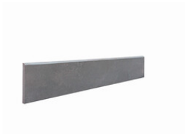
RODAPIÉ 7,5X60 | 30X60 / 12"x24"