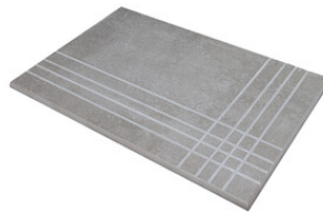
PELDAÑO ANGULO ROMO 30X60 | 30X60 / 12"x24"