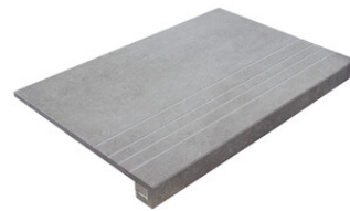
PELDAÑO GRADONE RECTO 30X60 | 30X60 / 12"x24"