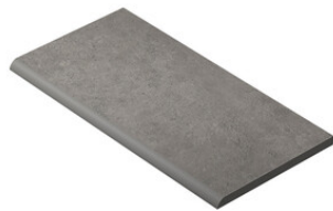
PELDAÑO ROMO 30X60 | 30X60 / 12"x24"