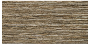
RELIEVE ARCATA STONE TERRA MATE 30x60 SL G.64 | MATT | Neutrale Scherben