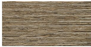
RELIEVE ARCATA STONE TERRA MATE 30x60 SL G.64 | MATT | Neutrale Scherben