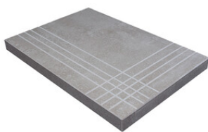
PELDAÑO ANGULO GRADONE RECTO 30X60 | 30X60 / 12"x24"