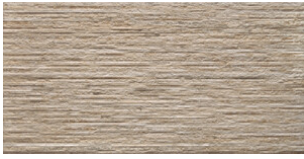
RELIEVE ARCATA STONE BEIGE MATE 30x60 SL G.64 | MATT | Neutrale Scherben